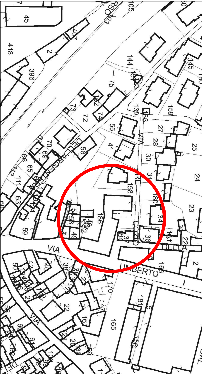
Comune di Susa (TO) - L013 - Foglio 5 - Particella 186